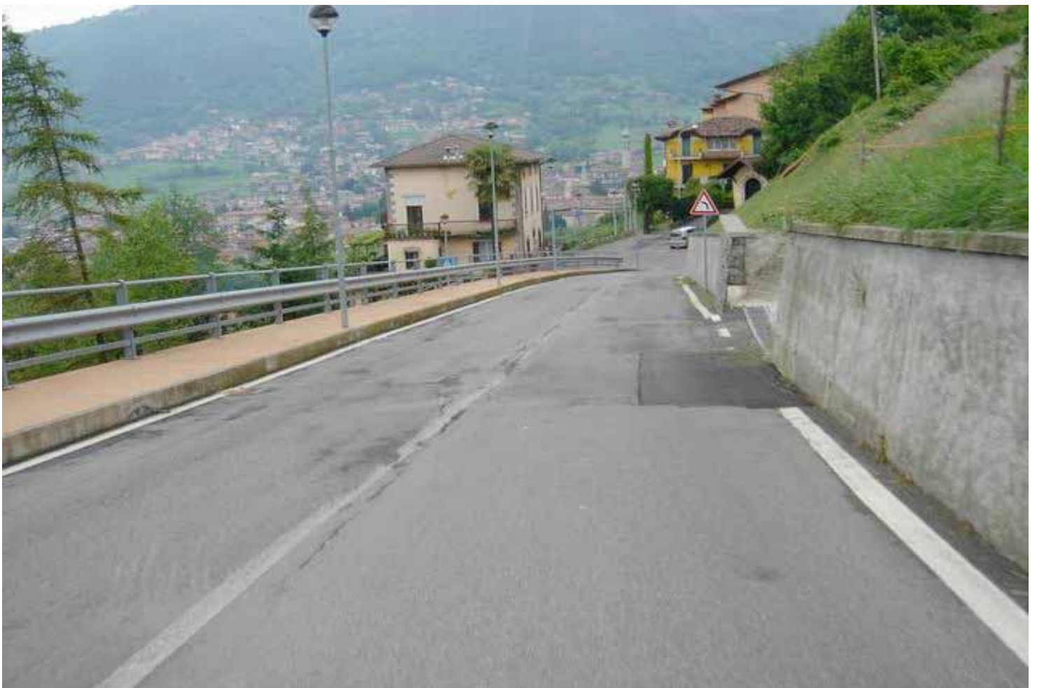
ECCOLO il 1° tornante , di grande difficoltà in quanto la velocità, anche se rallentata dalla chicane e' abbastanza alta e porterà a qualche derapata.