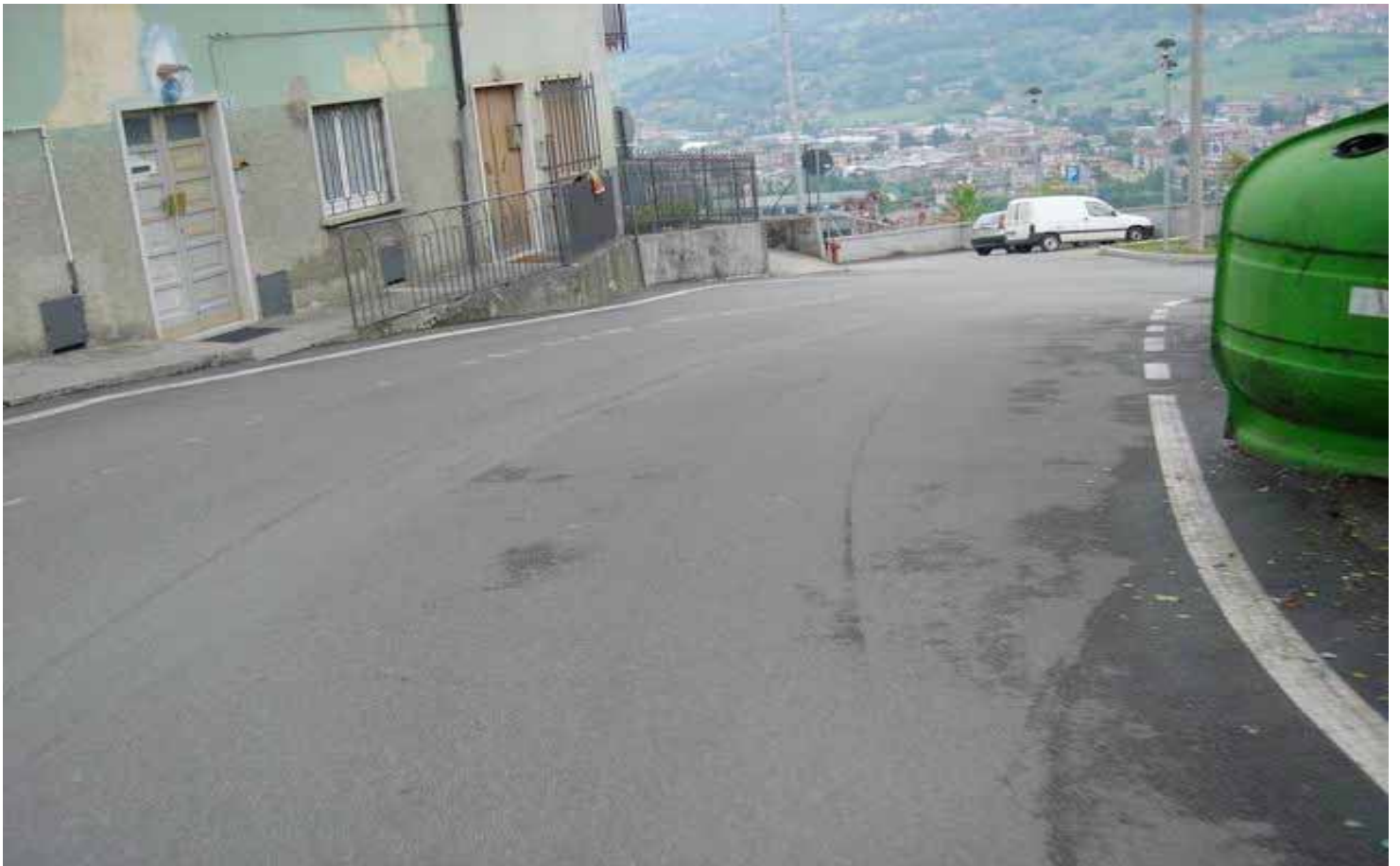
Curva verso destra che immette nella parte forse più in pendenza del tracciato