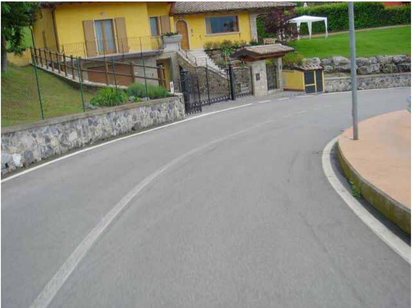
Tratto di puro scorrimento , senza difficoltà