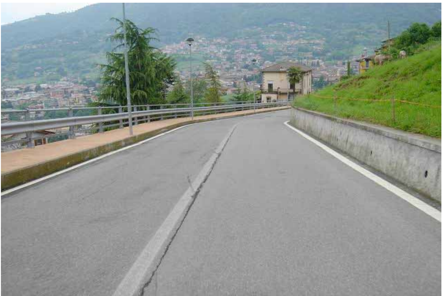
tratto di preparazione al tornante .