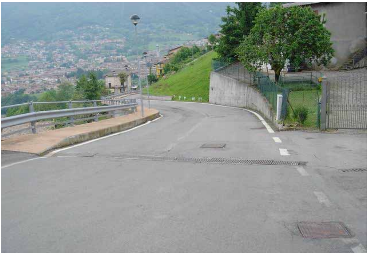
particolari del tracciato , rettilineo dove sarà posta la seconda CHICANE nelle prossime 3 foto