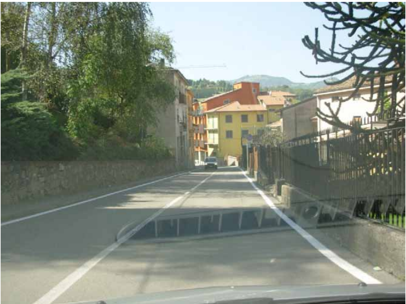
CURVA A SINISTRA CHE IMMETTE AL RUSH FINALE