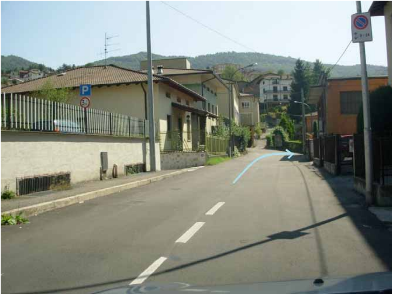
Curva a DESTRA A 90 °