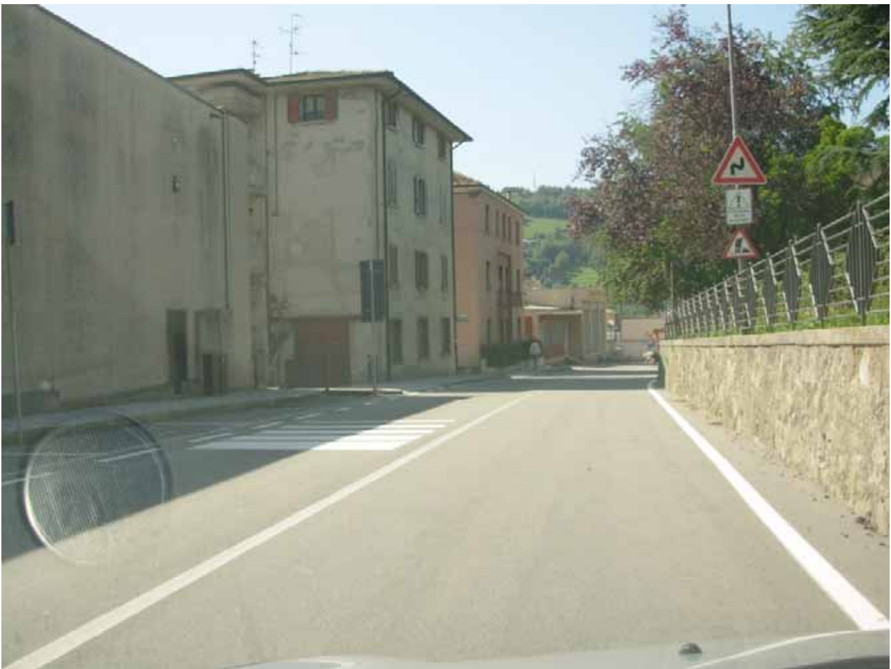
Ultime curve impegnative , curva a destra che chiude ...