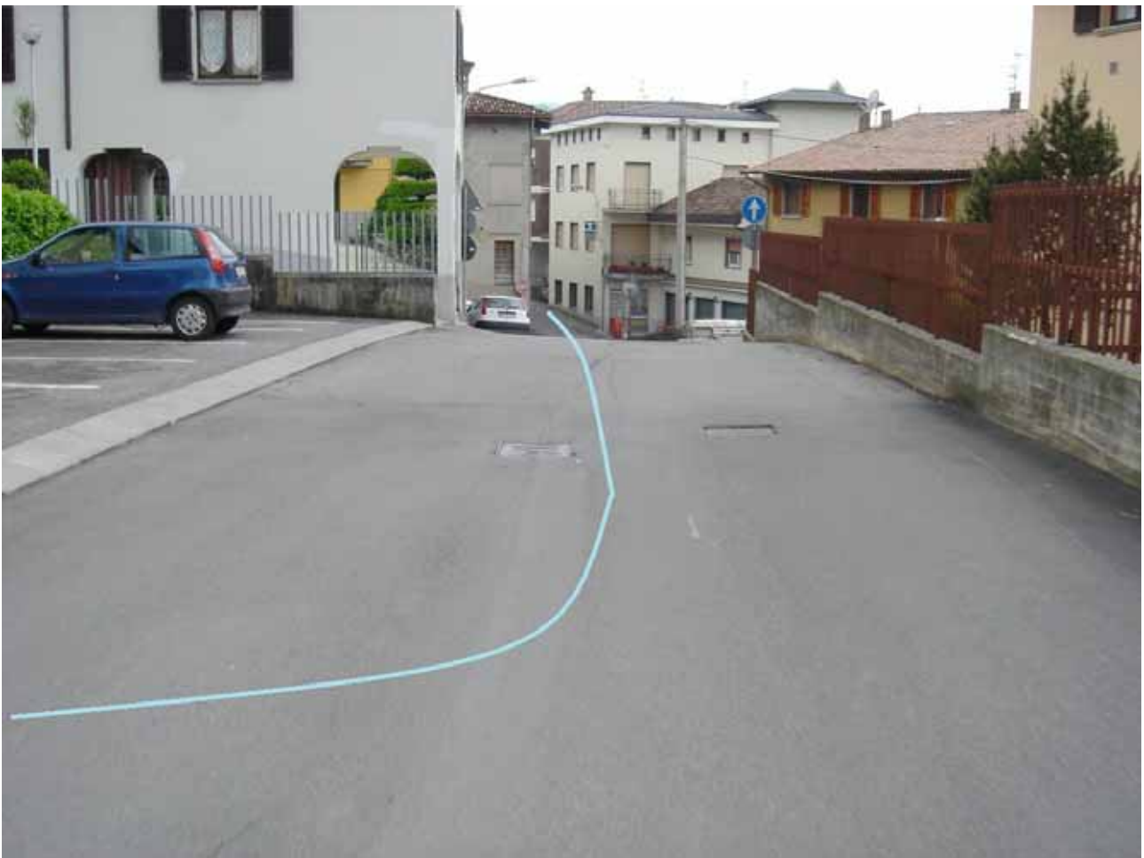
Rettilineo ( è quello del tornantino di Peia ) qui di solito si gira a destra nel tornantino ,ma noi andremo dritti .