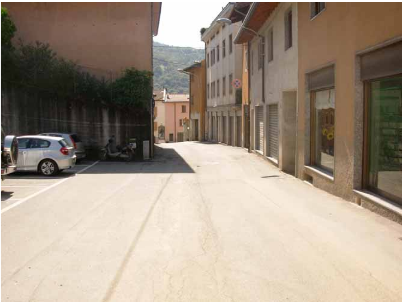
Finito il rettilineo si curva a DESTRA un po' in contropendenza ( c'è spazio anche per chi sbaglia ...)