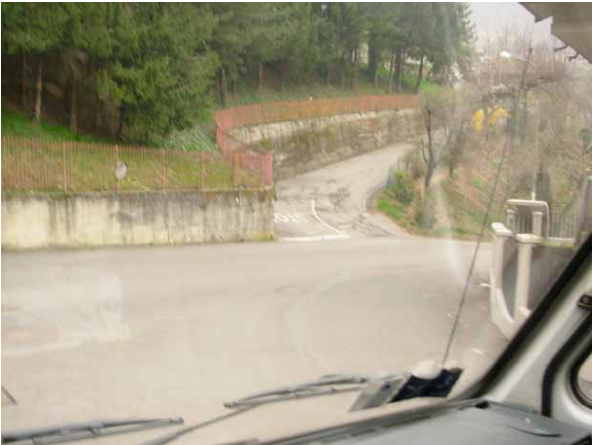
ad un altro piccolo rettilineo