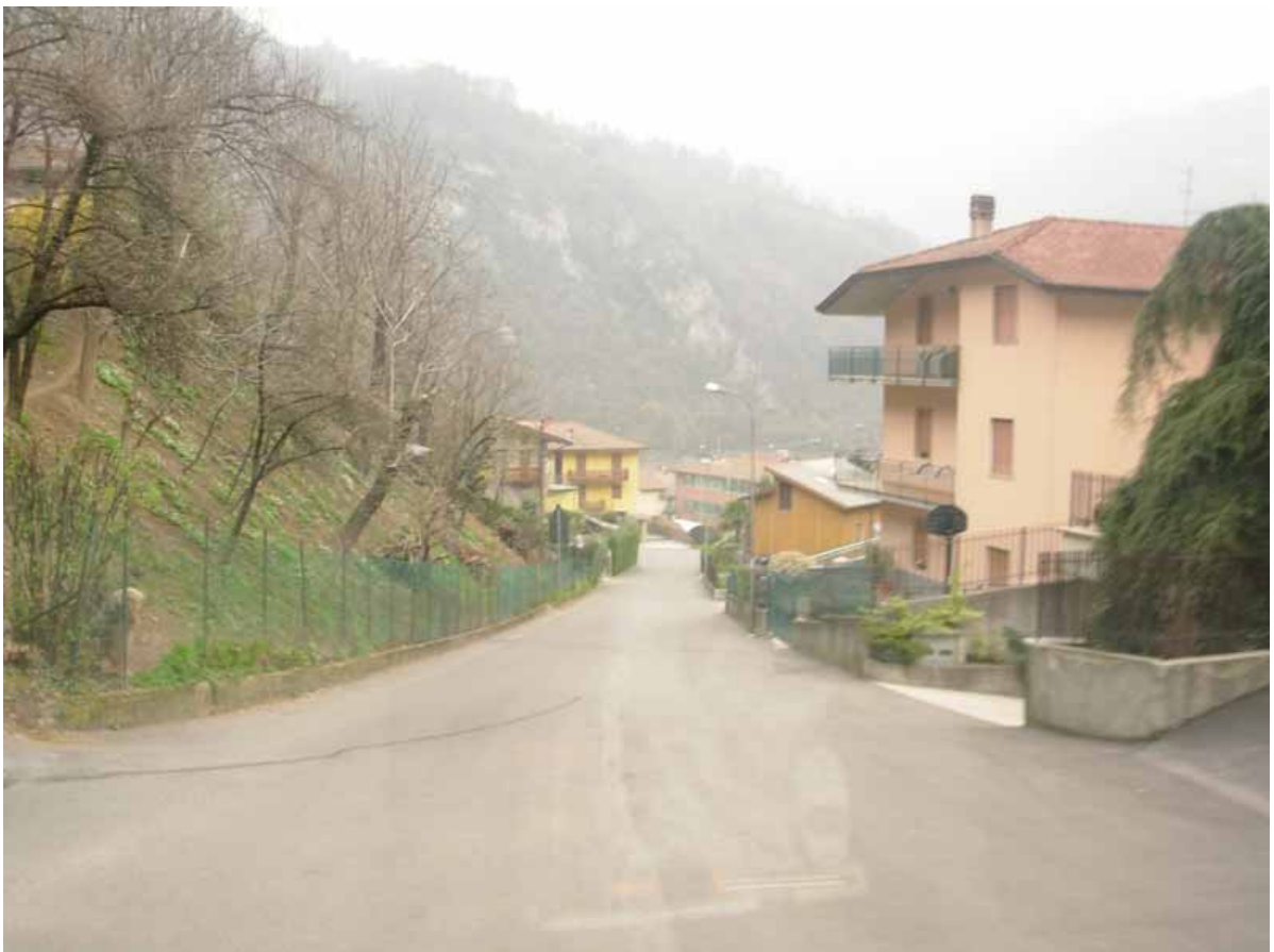
con buona pendenza dove è posta la 6 a chicane prima dell'ingresso verso destra al falsopiano.