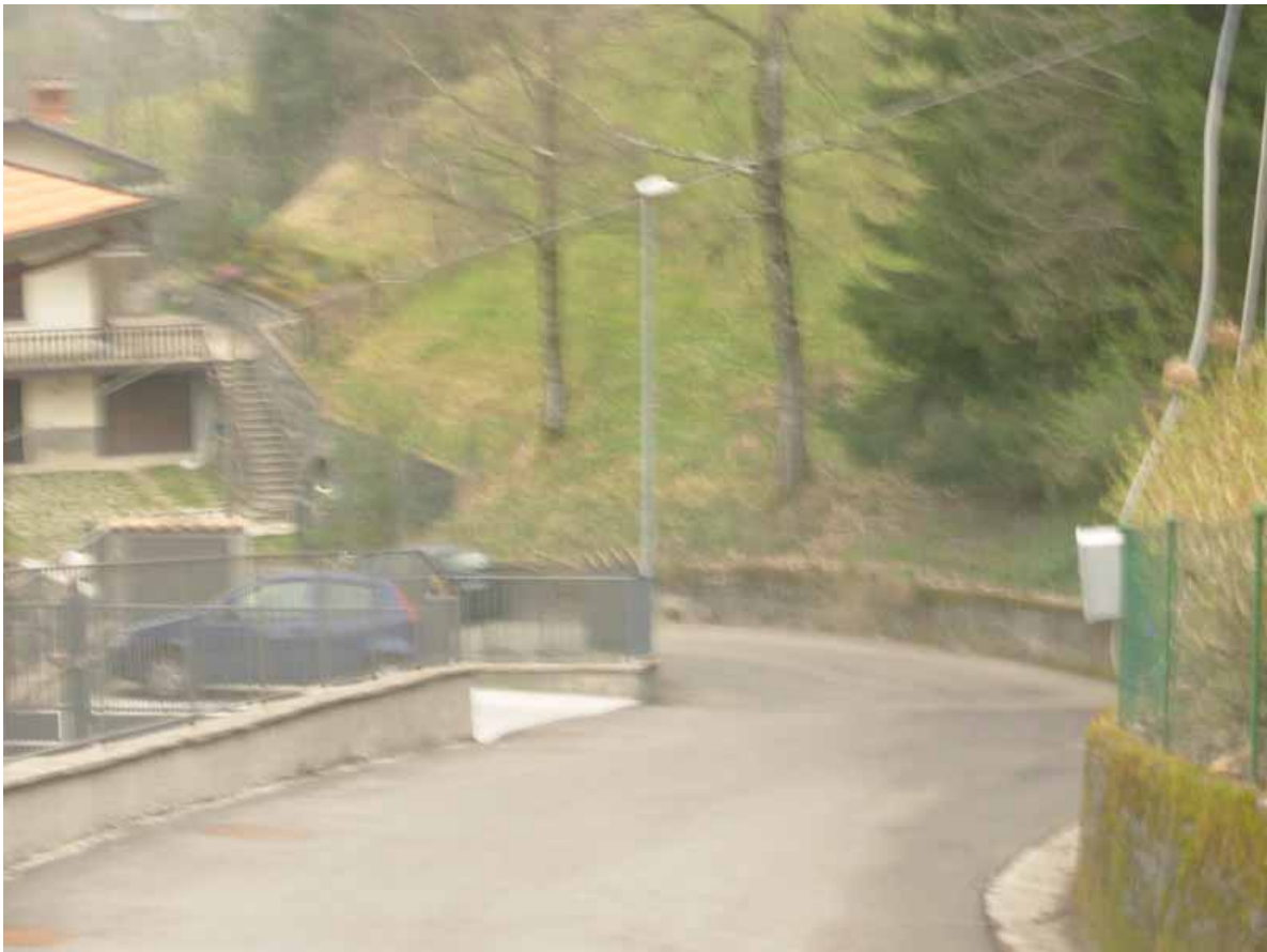
finita la stessa, dolce curva verso destra