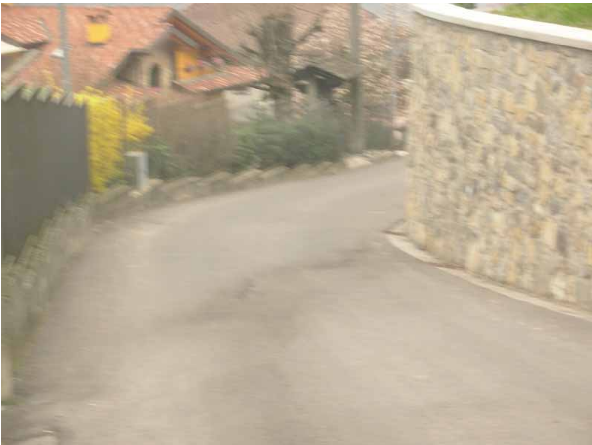
e arrivo sulla 4 a chicane prima della massima pendenza del percorso